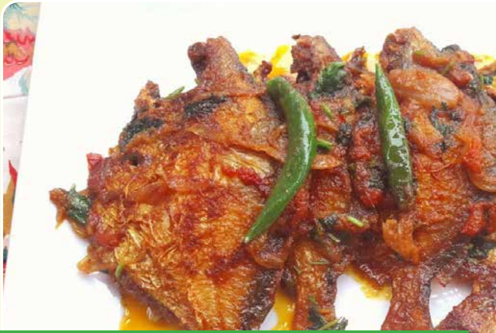
চোল ছাড়া দুধের খাসির বিরিয়ানি

পরিচয় ডেস্ক: বিরিয়ানি বিভিন্ন উপায়ে রান্না করা যায়। কেউ পছন্দ করেন সবজি বিরিয়ানি আবার কারো পছন্দ চিকেন, বিফ বা খাসির বিরিয়ানি। কিন্তু যেভাবেই রান্না করুন না কেন তেল ব্যবহার তো করতেই হয়, নাহলে তো আর স্বাদ হবে না বিরিয়ানির। তবে জানলে অবাক হবেন, তেল ছাড়া দুধ দিয়েই রাঁধতে পারেন মজাদার খাসির বিরিয়ানি। একবার খেলেই মুখে লেগে থাকবে এর স্বাদ।