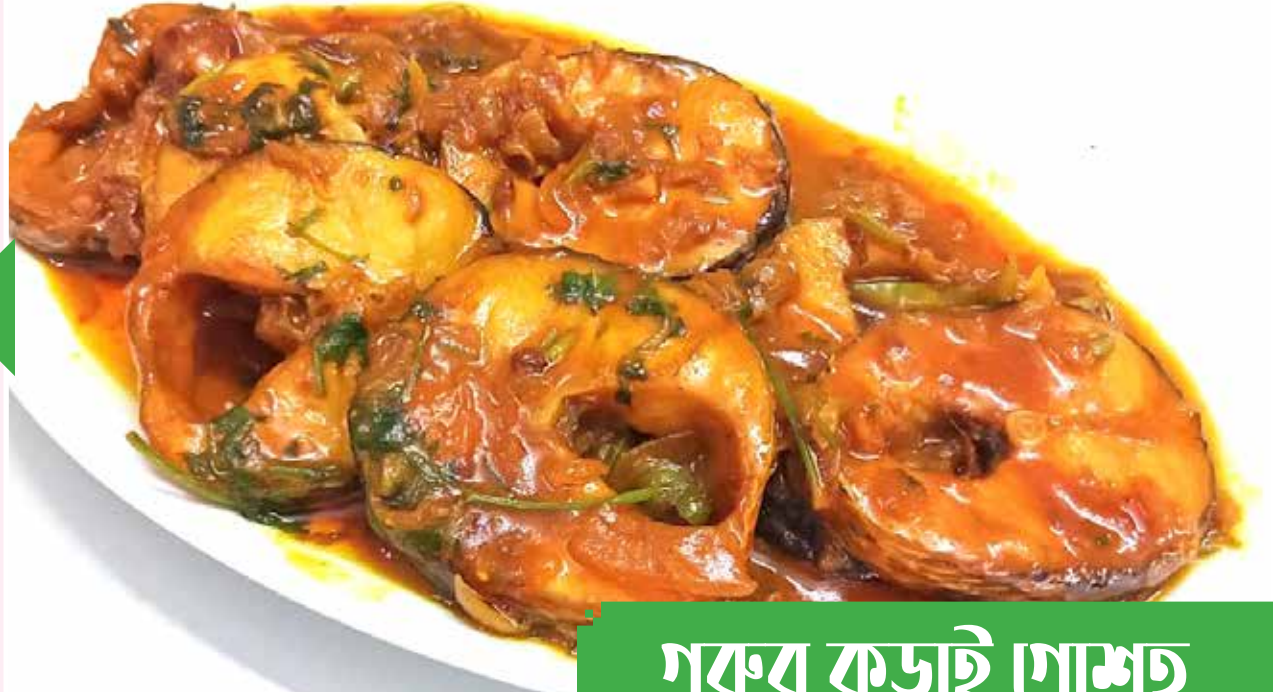
গরুর কড়াই গোশত

এরপর রান্না করা মাংস এই বাগারের মিশ্রণে ঢেলে ২-৩ মিনিট দমে রেখে দিন। তারপর নামিয়ে গরম গরম পরিবেশন করুন গরুর কড়াই গোশত। ভাত, রুটি, পরোটা দিয়ে দারুণ মানিয়ে যাবে পদটি।