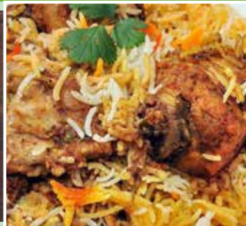
সুস্বাদু খাবারের ঘরোয়া আয়োজন