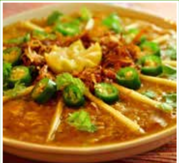
ঘরোয়া স্পেশাল কাচ্চি বিরিয়ানি

আরেকটি পাতলা কাপড়ে শাহী জিরা, এলাচ, লবঙ্গ, দারুচিনি ভরে একই রকমভাবে সুতো দিয়ে মুখ বেঁধে নিন। একই রকমভাবে তৈরি করতে হবে আরেকটি পুঁটলি। তাতে দিতে হবে খেঁতো করা আদা, রসুন এবং পেঁয়াজ কুচি। প্রেশার কুকারে মাংস নিন। তাতে তিনটি পুঁটলি, এক চামচ ঘি, দেড় কাপ পানি, দুই কাপ দুধ ও পরিমাণমতো লবণ দিয়ে ৪-৫টি সিঁটি দিয়ে নিন। লবণের পরিমাণটা ব্যালেন্স রাখুন। কুকারের ভাপ বের হয়ে গেলে ঢাকনা খুলে চামচ দিয়ে মাংস খুব ভালো করে নেড়ে নিন। এবার তা থেকে সাবধানে তিনটি পুঁটলি চিমটা দিয়ে তুলে নিন। ধীরে ধীরে মাংসগুলোও আলাদা করুন। এবার একটি বড় পাত্রে ঘি মাখিয়ে নিন। তাতে আধা সেদ্ধ বাসমতি চাল ছড়িয়ে একটা বেড তৈরি করুন।